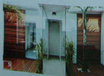
Veja seção Endereços

Reportagem: Eliana Medina e Luciana Jardim